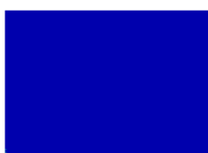
PANTONE REFLEX BLUE